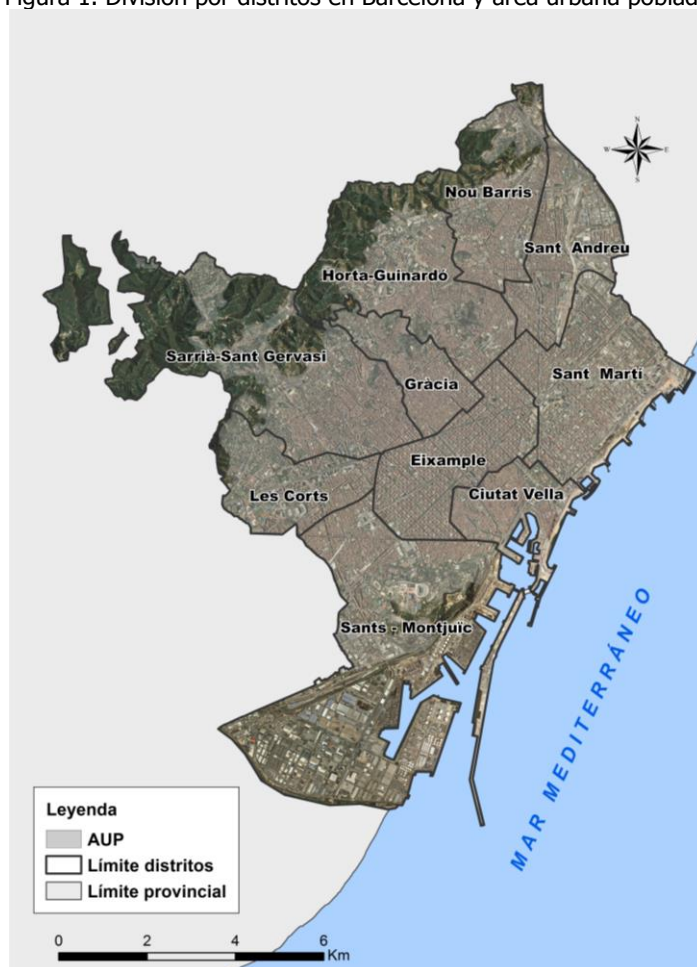
Figura 1. División por distritos en Barcelona y área urbana poblada