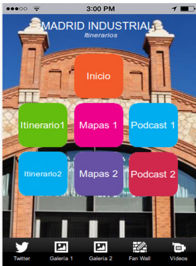
Figura 2. Madrid Industrial, Itinerarios.